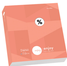
I Enjoy-boken du har fått utdelt

Fullstendig oversikt over alle aktørene finner du flere steder: